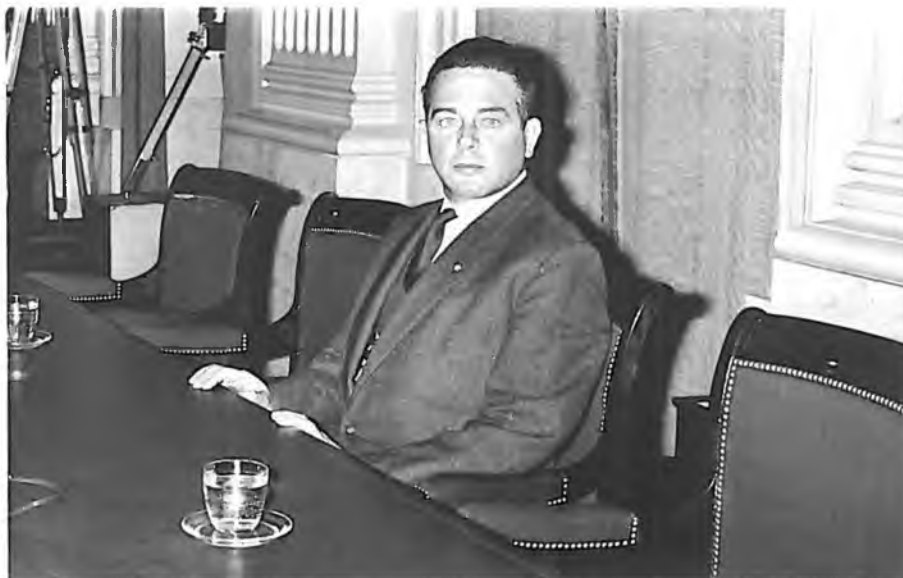
Premier Marijnen zwijgt in de Tweede Kamer, 1 maart 1965.

premier in zijn zwijgen. 7 Volgens Smallegenbroek hoefde de regering geen informatie te verstrekken wanneer het staatsbelang in het geding was – al gaf hij niet aan waarom dat juist nu het geval zou zijn. Beernink meende dat er pas inlichtingen konden worden verstrekt als een informateur de geschilpunten had geïnventariseerd. 8