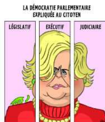
FIGURE 1. LA SÉPARATION DES POUVOIRS Par Anne-Marie Lizin