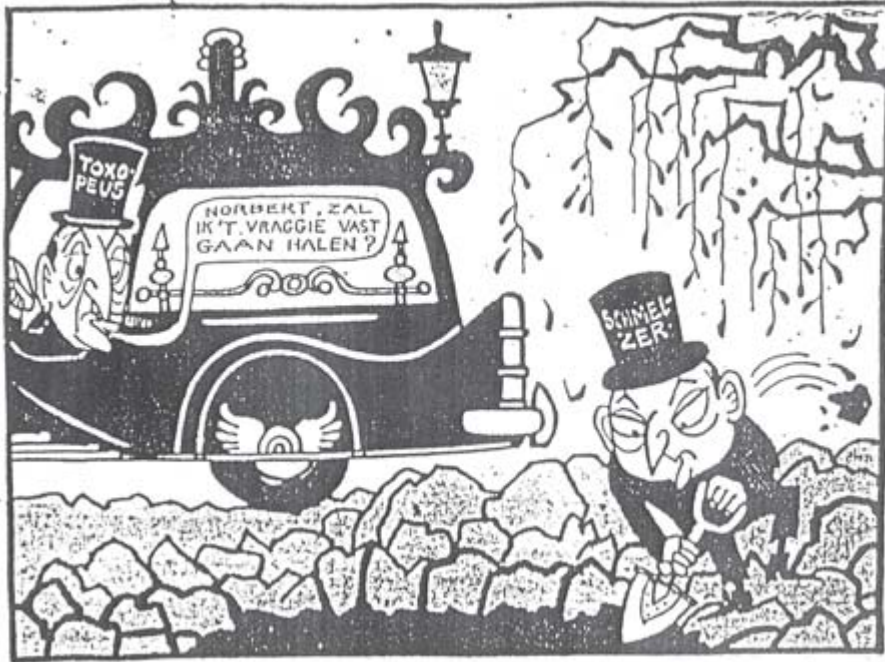
‘Norbert, zal ik ’t vraggie vast gaan halen?’, de Volkskrant , 13 oktober 1966 [Opland, c/o Pictoright Amsterdam 2010]

signaleerde ‘in brede kringen een vertrouwenscrisis’, maar tijdens het debat moest maar blijken of het kabinet nog steeds voldoende vertrouwen van de Kamer genoot. 85