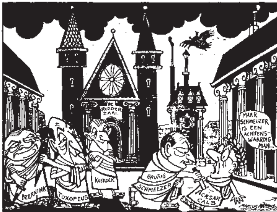
‘Verraad: “... Ook jij, Norbert!”’, de Volkskrant , 15 oktober 1966 [Opland, c/o Pictoright Amsterdam 2010]

publicitaire zin evenmin onbetuigd en sloot zich aan bij de argumentatie van zijn toenmalige financiële rechterhand in de fractie. 8